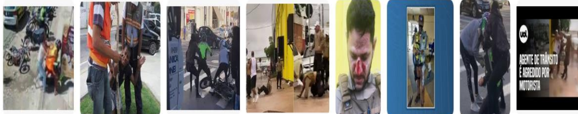
G1 - Globo.com Câmera flagra lutador de MMA ... O GLOBO Motorista agride agente de trânsito ... Jornal Mantiqueira Agente de trânsito é agredido e ... Terra Agente de trânsito é agredido ao mult... UOL Notícias Motorista agride a... G1 - Globo Em 4 meses, foram registrad... Prefeitura de Poços d... Prefeitura de Poços d... YouTube Agente de trânsito é agredido...