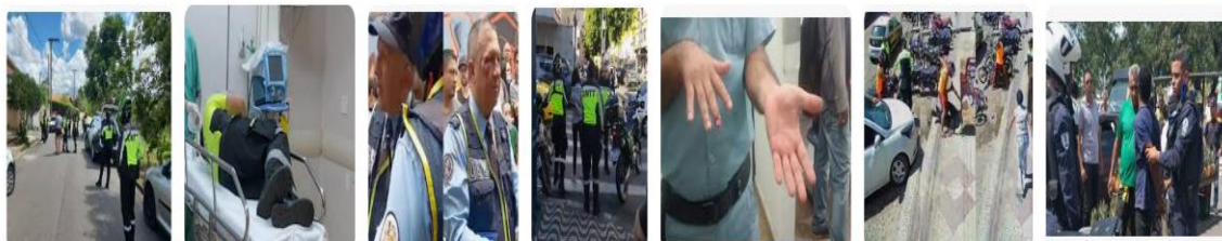
TV Poços Agentes do Demutran são agredido... GRU Diário Motorista agride agente de trânsito a... Infobae Agente de trânsito em Belo foi ... Prefeitura de Poços de C... Prefeitura de Poços de ... Prefeitura Municipal de Imperatriz Agente de trânsito é agredido por motoci... Confirma Notícia VIDEO: Lutador de MMA nocauteia ... A Gazeta A Gazeta | Motorista leva multa, se revol...