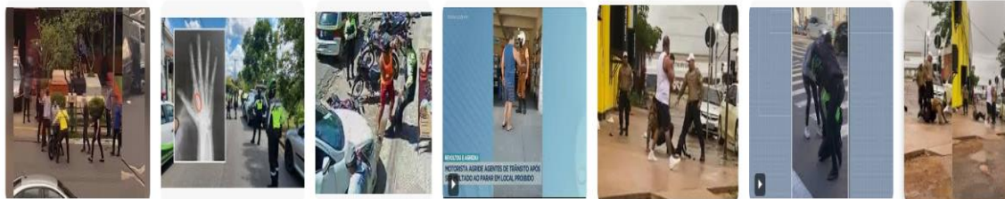
Mais Goiás Motoriclista agride agentes de trânsito... PoçosCom Agente de trânsito sofre fratura na mão... AGT Brasil AGT-Brasil repudia ato de agr... Recon TV - R7.com Agente de trânsito é agredido por mot... - Mais RD Agente de trânsito é agredido brutal... G1 - Globo VIDEO: Agente de trânsito é agredido... Mais Goiás Motorista agride agente de ...